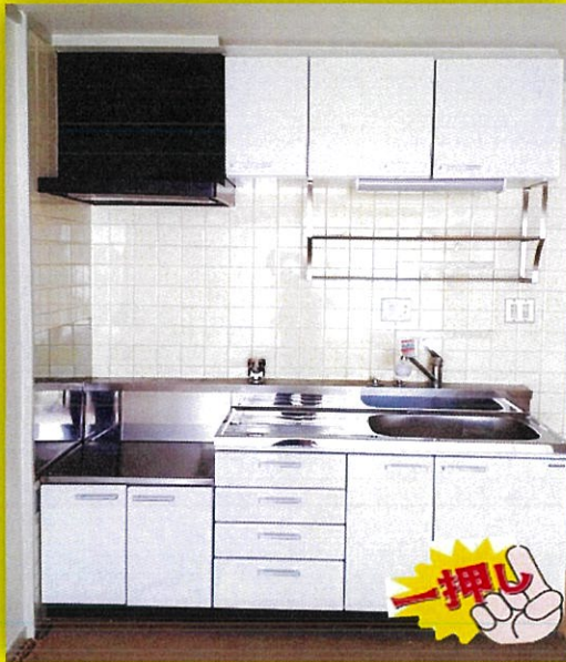
流し台一式 新規入替え