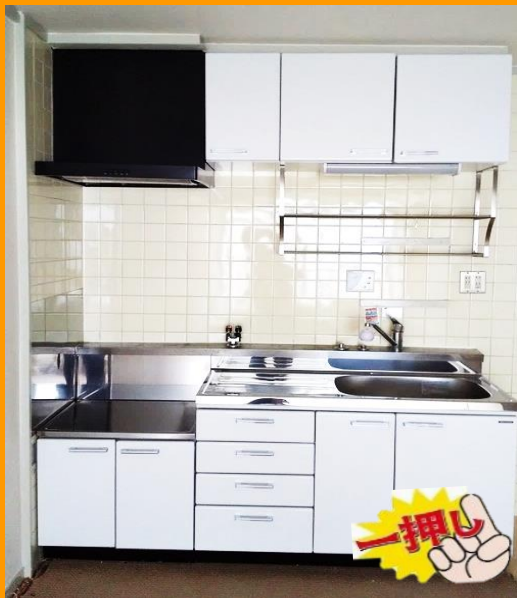
流し台一式 新規入替え